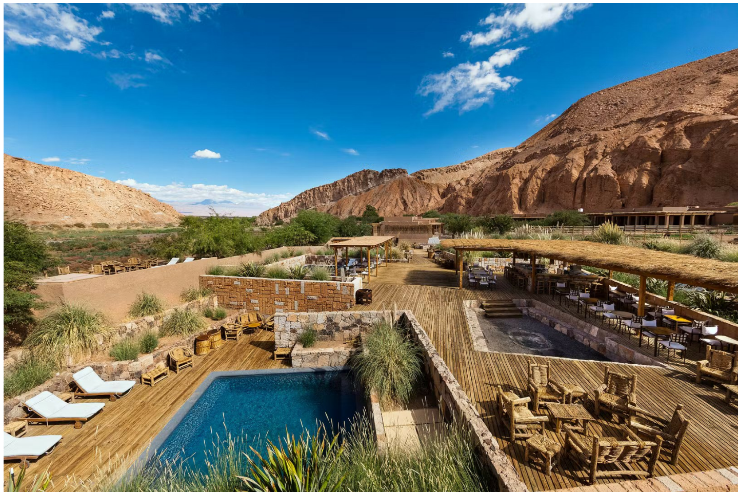
San Pedro de Atacama

Diese komfortable Eco-Lodge bietet ein sehr angenehmes Ambiente und zeigt den Gästen die Einzigartigkeit der Atacama-Wüste und ihren kulturellen Wert.