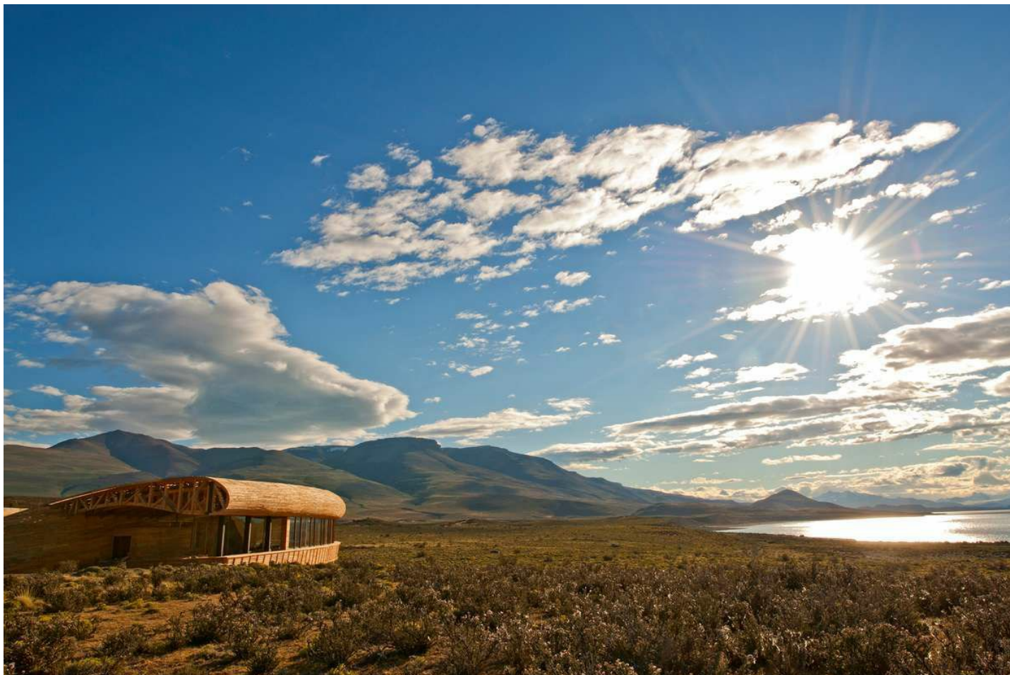
Torres del Paine

Mitten in der Natur und dennoch nicht auf Komfort verzichten? Im Luxushotel Tierra Patagonia können Sie die Seele baumeln lassen.